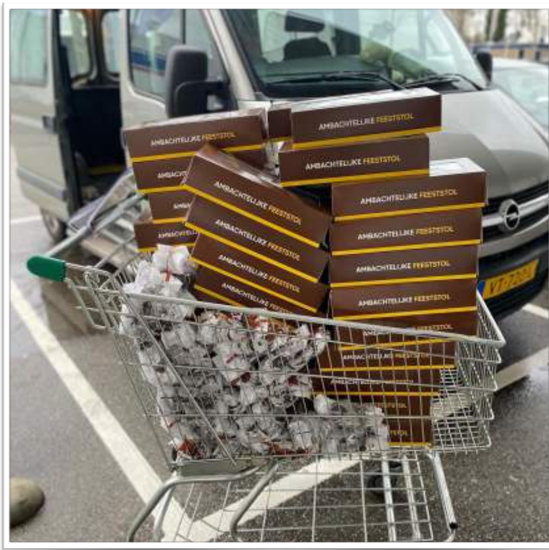
Donatie van de Sligro voor kerst: Luxe Kerststollen & chocolade kransjes.

Door vast te houden aan deze kernwaarden en ons te richten op onze missie en visie, streven we ernaar om een positieve en blijvende impact te hebben op de Doetinchemse gemeenschap en het welzijn van haar inwoners.