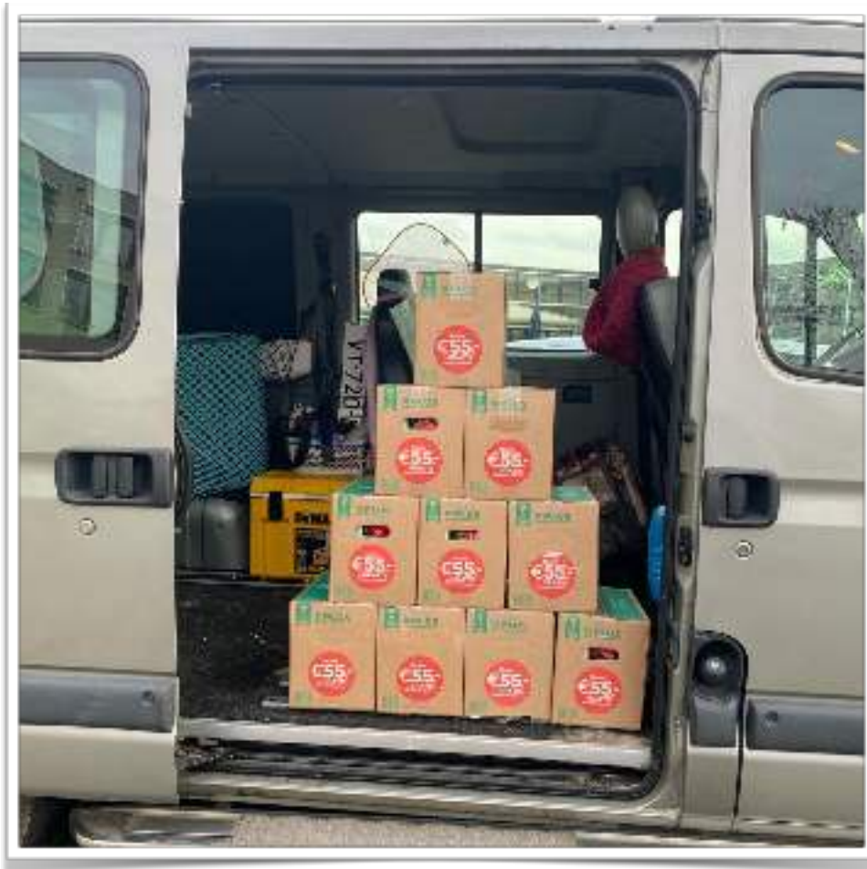
Een prachtige donatie PlusPakketten namens de lokale Kinderboerderij.

Besluiten kunnen genomen worden tijdens bestuursvergaderingen, ad-hoc vergaderingen en vergaderingen van digitale aard (bijvoorbeeld via jitsi.org ). Als eis moeten er minimaal twee van de drie bestuursleden aanwezig zijn. Besluitvorming geschiedt middels stemmen, de meerderheid van de stemmen telt. Elk bestuurslid heeft één stem. Als er tijdens een stemronde geen meerderheid behaald wordt, is er de mogelijkheid om nogmaals de voor- en nadelen te beargumenteren en daarop een tweede stemronde te houden. Is het resultaat bij de tweede stemronde hetzelfde, dan wordt het besluit opgeschoven naar de eerstvolgende vergadering waar een derde stemronde wordt gehouden. Blijft bij de derde ronde een meerderheidsbesluit uit staat het de voorzitter vrij om een bindende keuze te maken voor dit besluit.