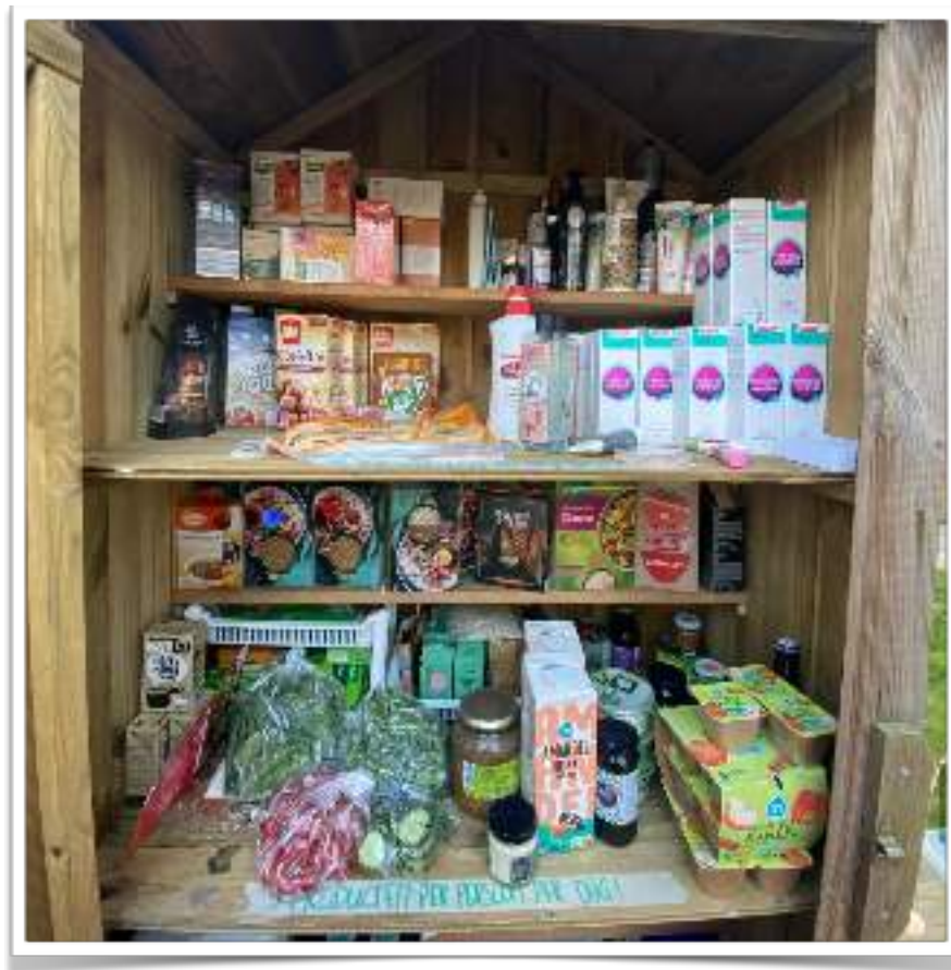
DeelKastje Slotlaan flink bijgevuld.